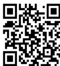
メールアドレスのQRコード